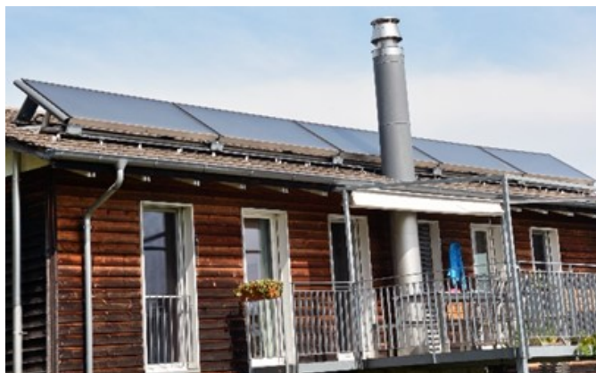
(Die thermische Sonnenenergienutzung kann beim Heizungsersatz ein anderes Heizsystem sinnvoll ergänzen)