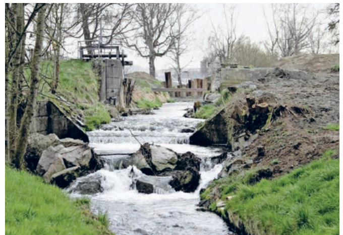
Rückbau Willisdorfer Wehr, 2023.