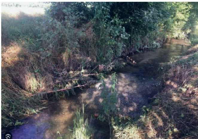
Renaturierter Abschnitt Schlattingen-Basadingen, 2020.

wie Rhein und See. Jährlich zieht es die Tiere zurück in ihre Kinderstube um sich zu Paaren. Wir konnten in den letzten Jahrzehnten immer wieder grössere Forellen am Willisdorf Wehr beobachten, die den Weg zum oberen Bachverlauf suchten. Schon nach einigen Wochen nach Abbruch des Wehrs entdeckten wir Alet Fische oberhalb von Schlattingen,